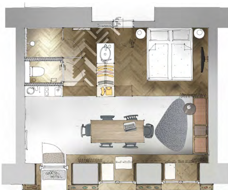
Grundriss Grätzl Karmelitermarkt, „Die Lampenmacherin“, o. M.