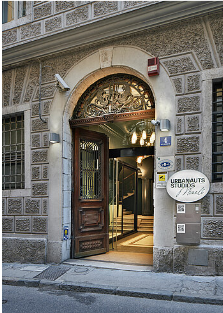
Die Urbanaut Studios Minelli sind in einem historischen Palazzo untergebracht.