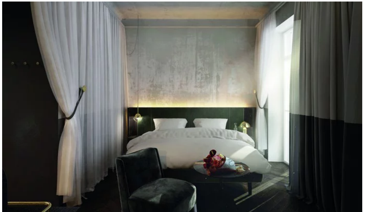
Das Fünf-Sterne-Grand Hotel Straubinger am Straubingerplatz verfügt über 46 Zimmer und Suiten.

Top Spa stehen Spa und Infinity-Outdoor-Pool sowie drei Saunen zur Verfügung.