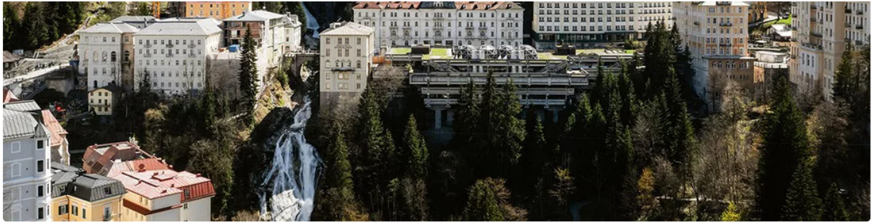
Das Grand Hotel Straubinger und das Badeschloss sollen am 1. September 2023 eröffnen.

An einem Ort der Extreme, vom Tal bis zu Gipfeln mit über 3.000 Höhenmeter, bilden das Mitte des 19. Jahrhunderts gebaute Straubinger und das Ende des 18. Jahrhunderts eröffnete Badeschloss das Herzstück von Bad Gastein. In den altherwürdigen Gebäuden residierten bereits Kaiser und Fürsten wie Kaiser Franz Josef. Und auch in der Weltpolitik erlangte das Ensemble an Bedeutung: 1865 wurde hier der Gasteiner Vertrag zwischen Preußen und Österreich geschlossen.