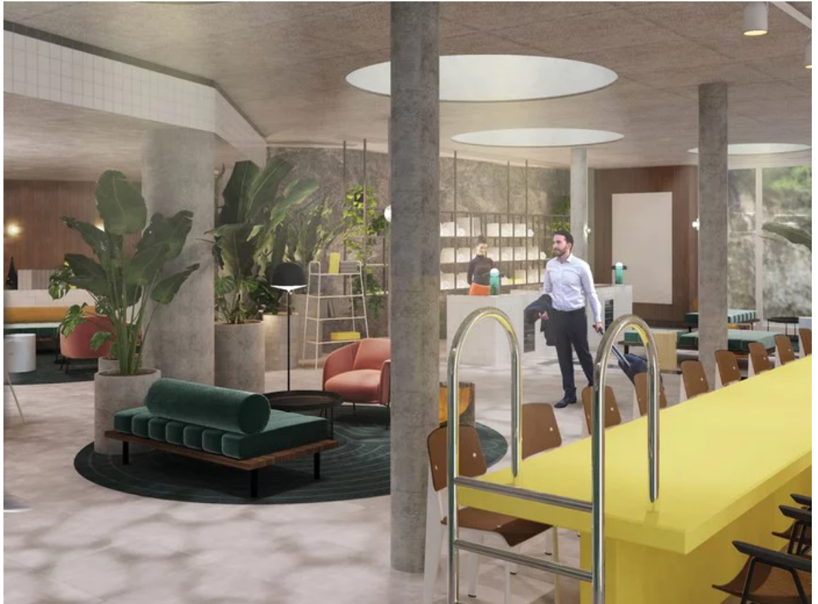
Das Badeschloss hat ganzjährig geöffnet. (Foto: © BWM Architects & Design)