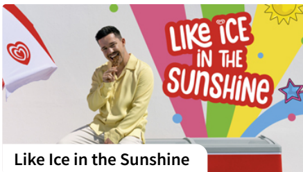
Like Ice in the Sunshine