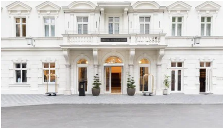
Das Grand Hotel Straubinger in Bad Gastein öffnet am heutigen Freitag erstmals seine Türen.