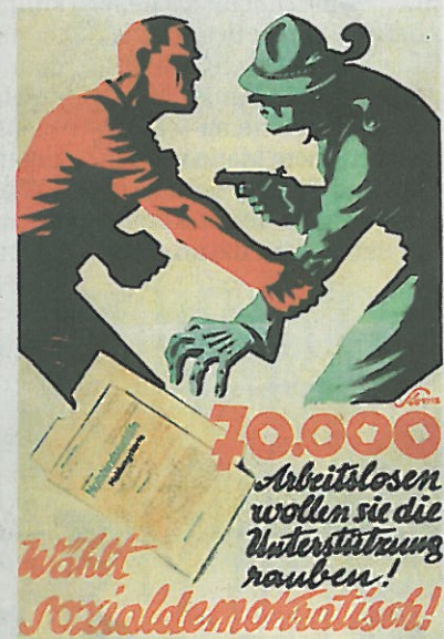
Rot gegen Hut: Wahlplakat, 1930