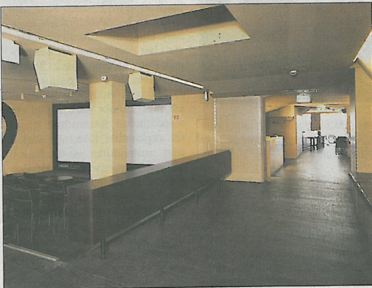
Freundlich und hell: Das Cinema Paradiso besticht durch seine moderne und offene Architektur.

Über die gefaltete Glasfassade öffnet sich das Kino auf den Rathausplatz. Außenraum und Innenraum greifen mit einer Passage ineinander, auf diese Weise werden die Aktivitäten des Kinos auch nach außen kommuniziert und tragen zur kulturellen Belebung der St. Pöltner Innenstadt bei.