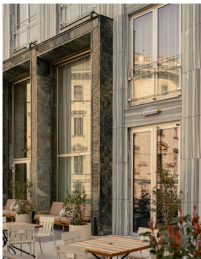
BWM_The Hoxton Vienna_Facade 03 © BWM_Designers & Architects_Ana Barros