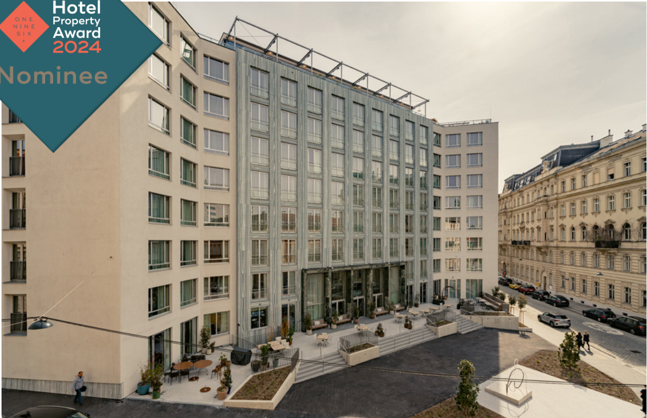
BWM_The Hoxton Vienna_Facade 01© BWM_Designers & Architects_Ana Barros