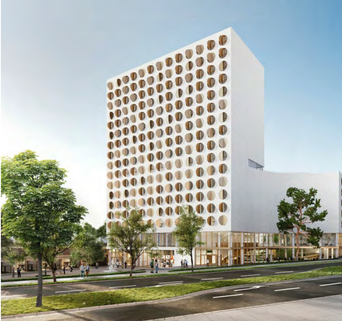
Markant: Das Revo München mit seinen runden Fenstern.

Mit der Marke Revo kommt ein Hotel-Living-Konzept nach München, das auch Com bereithält. Nach mehrjähriger Bauzeit beginnt mit Oktober das Soft Opening.