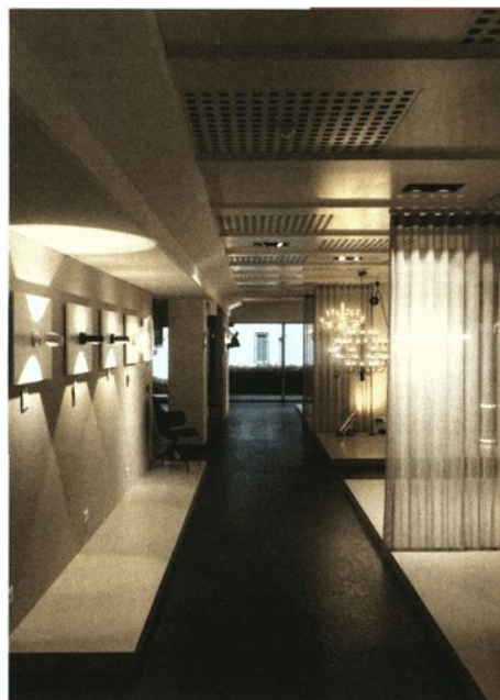
Beispiel von Sonderlösungen im Restaurant Caffè Sacher in Triest. Das Projekt wurde von der Lichtstudio Group gemeinsam mit den BWM Architekten ausgearbeitet.