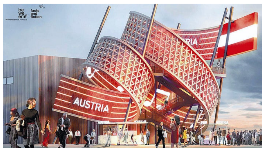
オーストリアパビリオンのイメージ図 ( (c) Expo Austria/BWM Designers & Architects )